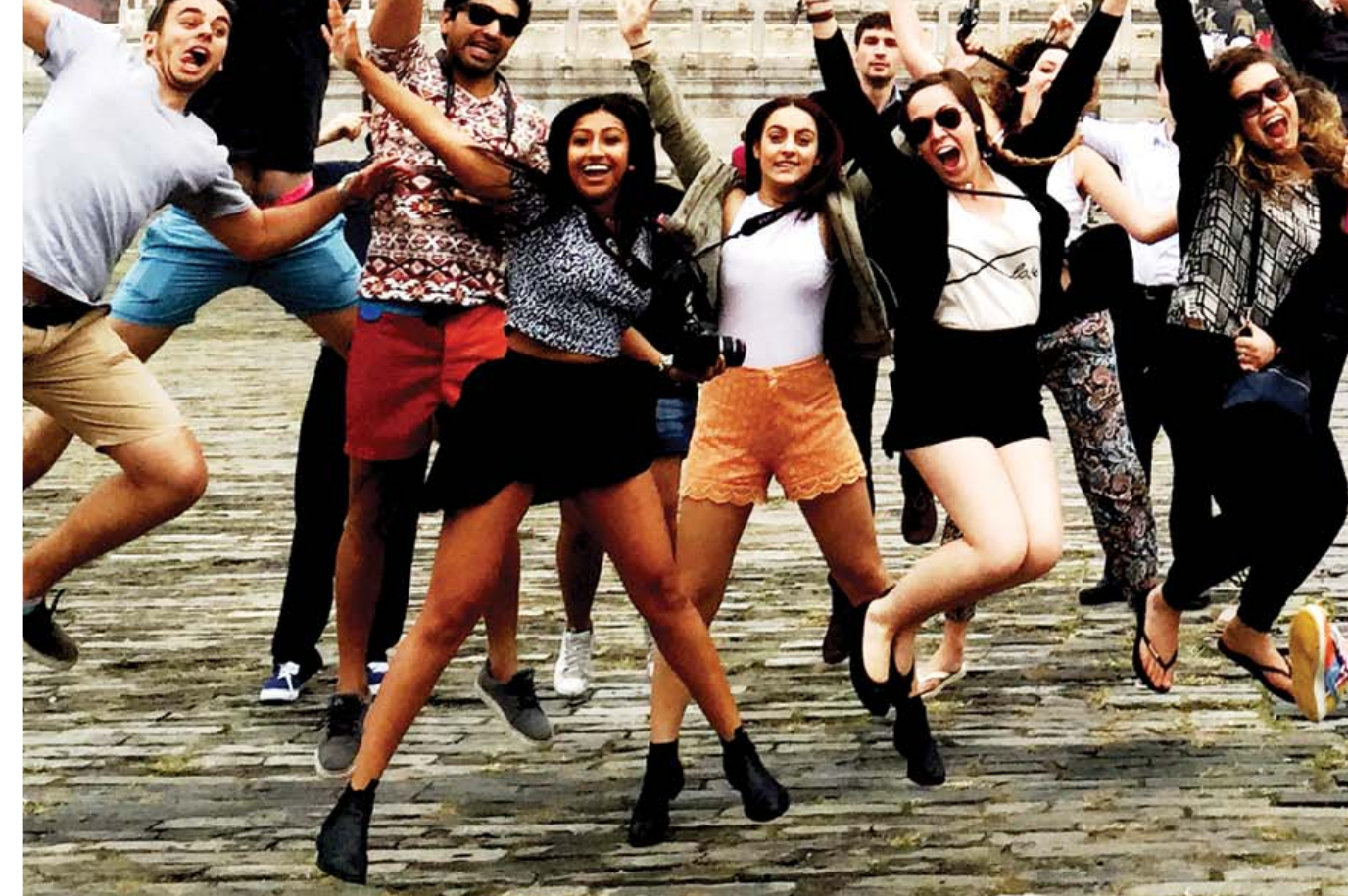
• Данные предоставлены туристической фирмой «Fantasy travel».