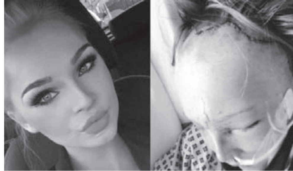
спас ремень безопасности.

Сложнейшая операция длилась около пяти часов. Через полторы недели пациентка смогла сделать первый вдох носом