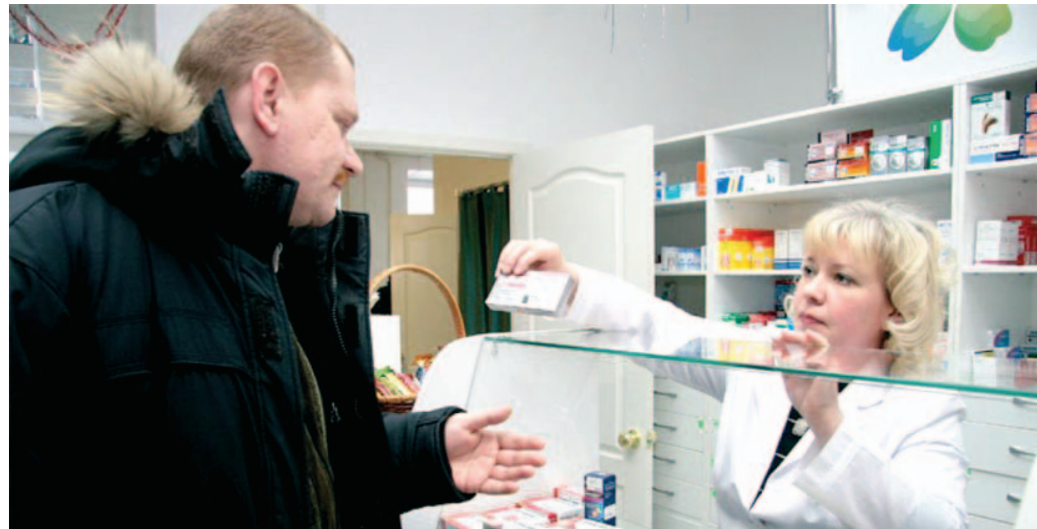
Иллюстративное фото krepnet