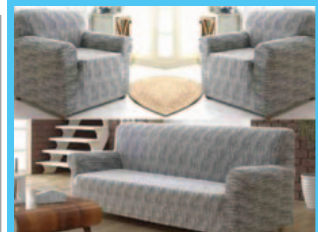
Стенка и мебель

Добротную стенку, особенно из цельных пород дерева, не выбрасываем – слишком ценный материал. Можно зачистить и покрыть лаком.