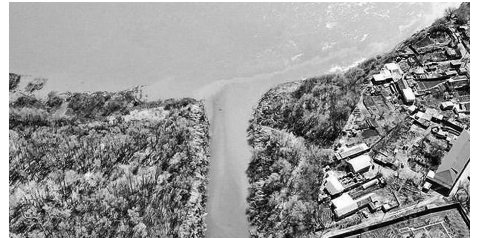
Фото из соцсети