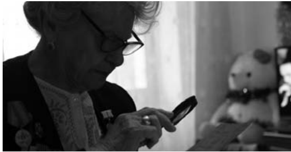
"Нас осталось очень мало"

«Кто испытал это на себе, на всю оставшуюся жизнь знает цену хлебу, не бросит и крошки, и даже выброшенный кем-то кусочек подберет и положит так, чтобы его склевали птицы. Хлеб – это жизнь» , – эти слова жительницы блокадного Ленинграда как нельзя лучше передают то, что пришлось вынести людям, пережившим 872 дня осады города. 27 января 2019 года исполнилось ровно 75 лет со дня снятия блокады Ленинграда. Осада города немецкими войсками началась в сентябре 1941 года и закончилась только 27 января 1944 года. Что пришлось пережить людям в то время, сейчас представить уже трудно, и лучше самих блокадников об этом вряд ли кто расскажет. Редакция портала Tengrinews.kz собрала воспоминания наших соотечественников, переживших эти по-настоящему страшные годы.