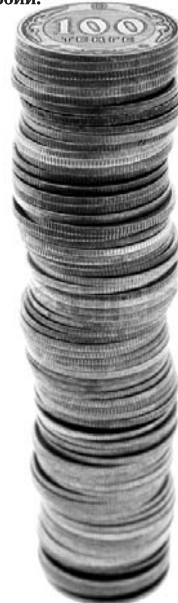
Данные предоставлены филиалом НАО «Государственная корпорация «Правительство для граждан» по ЗКО.

В связи с изменением размера месячного расчетного показателя, который составит в новом году 2525 тенге, будут увеличены размеры специальных государственных пособий.