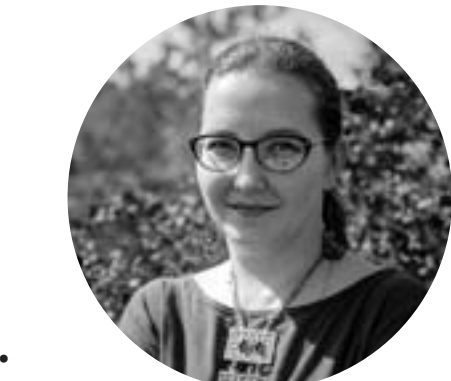
Иллюстрационное фото с сайта Яндекс.Новости

учает мир. Ему сейчас нужны пальчиковые краски, у него в 2 года еще нет потребности что-то нарисовать, он не понимает, что можно оставить след на бумаге. Ему действительно интересно, почему кисель, пюре и суп на ощупь разные. Кроме того, это позволяет развиваться здоровому пищевому поведению, не бояться новой еды.