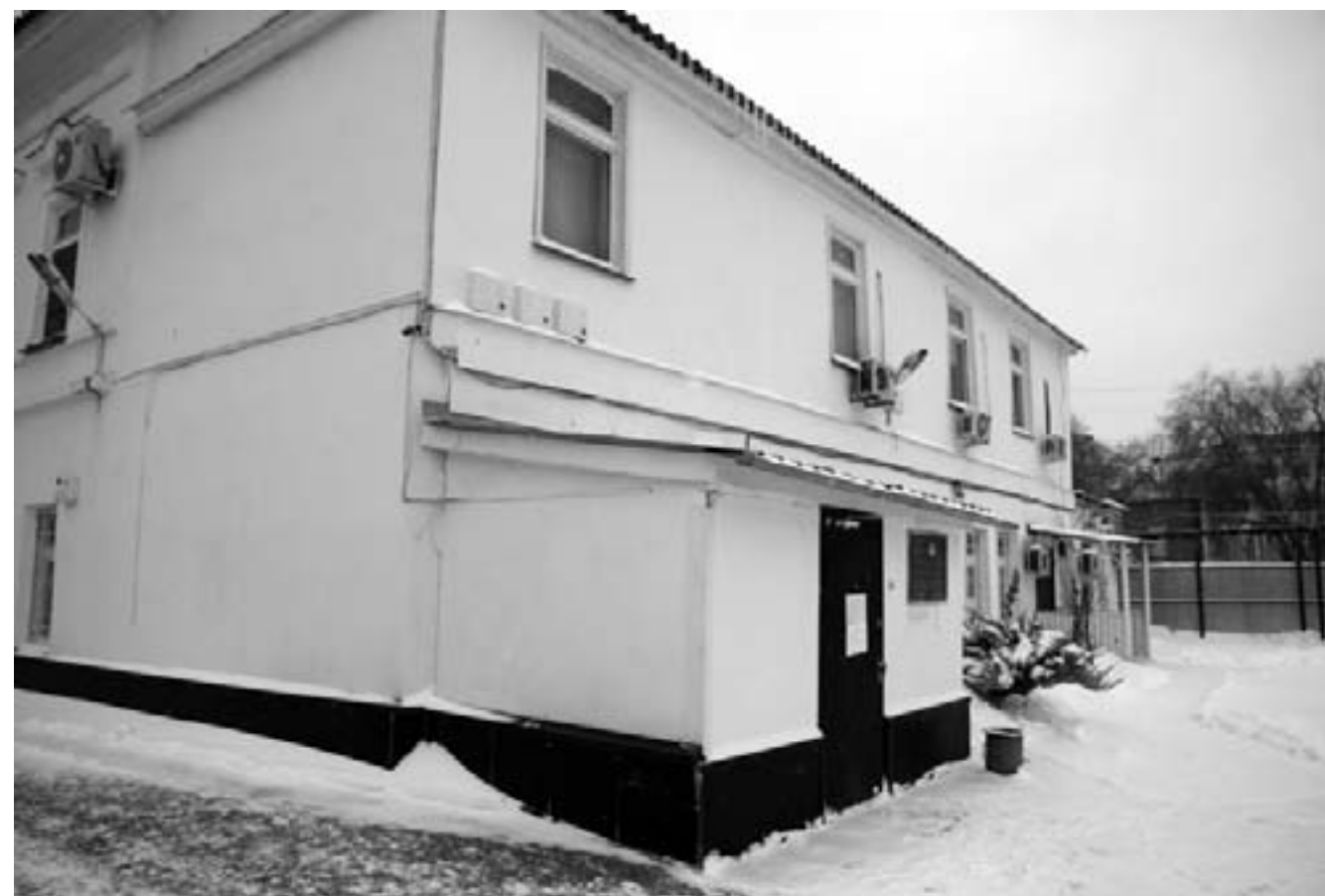
В ЗКО исследования на ВИЧ-инфекцию проводится в двух медицинских учреждениях – в областном центре по профилактике и борьбе со СПИД и в областном центре крови.

В областном центре по профилактике и борьбе со СПИД рассказали, что люди узнают о своем положительном ВИЧ-статусе от врача-эпидемиолога.