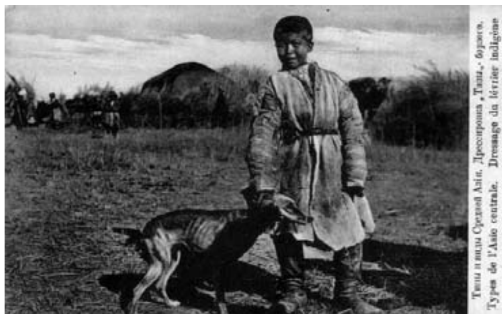
Тазы и яиц Сурашай Айт. Дресовина, Тана, Борзак. Types de l'Asie centrale. Dresseage de l'Asie indigène.

"Изображения подобного облика встречаются на петроглифах Южного Казахстана. Древнейшие из них археологи относят к 10–12 тысячелетиям до нашей эры. Мы можем начать исследование с тех