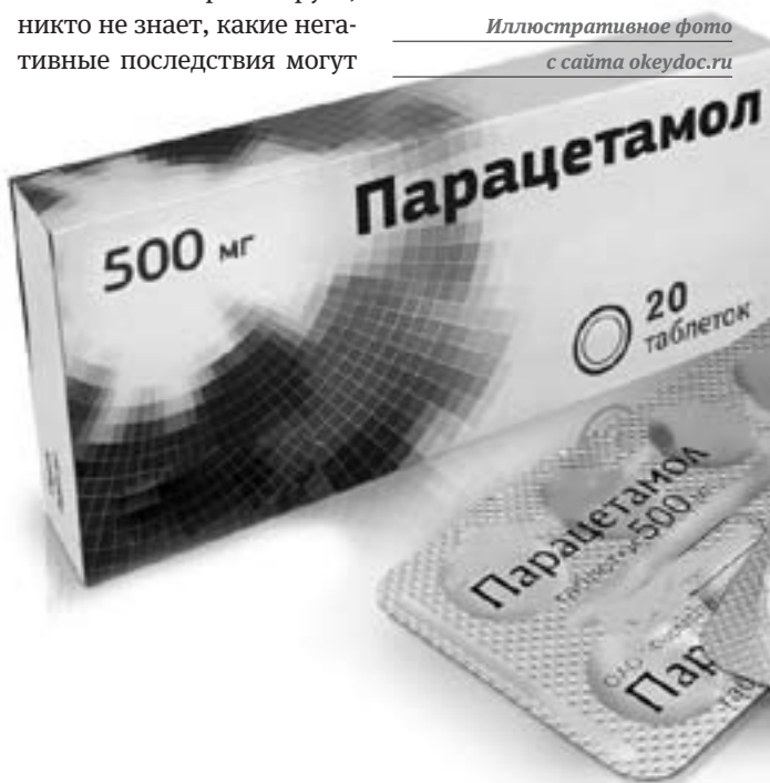
Иллюстративное фото с сайта okeydoc.ru

быть потом. Берегите себя и своих близких! Не бойтесь! — заключил глава региона.