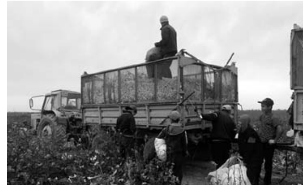
Дети собирают хлопок в мешки, взвешивают их и сдают. 29 сентября 2020 года.

каких-то базовых навыков самообслуживания и минимальных знаний. Теперь ребенок должен быть максимально подготовленным, чтобы быть конкурентоспособным, успешным. Это и цифровые навыки, и финансовая, и правовая грамотность, и умение разбираться в потоке информации. Поэтому важно, чтобы ребенок посещал школу, имел среднее образование, но помимо этого – важно и как он проводит время вне школы.