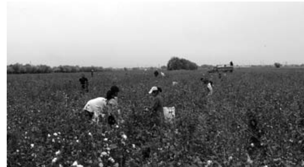
Дети школьного возраста на хлопковом поле. 29 сентября 2020 года.

– Детство – это период адаптации человека к условиям жизни, к современным ему реалиям. По мере того, как общество усложняется, период детства удлиняется, так как человеку необходимо получать все больше навыков. В современном мире, для того чтобы быть готовым к взрослой жизни, недостаточно