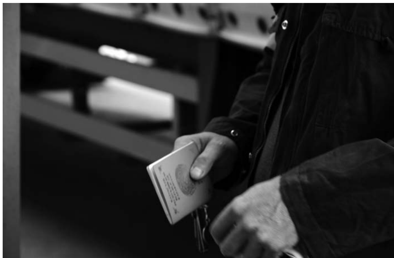
Между тем старший инспектор говорит, что это преследуется законом и на нарушителей составляется административный протокол по статье 496 КоАП РК "Нарушение законодательства Республики Казахстан о гражданстве".