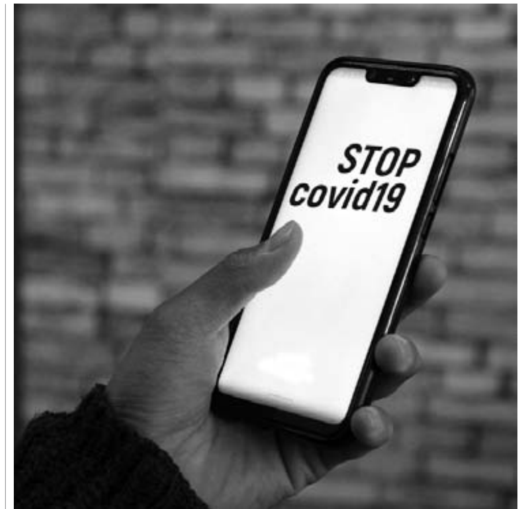
Иллюстрационное фото с сайта avesta-news.kz

По словам министра цифрового развития, инноваций и аэрокосмиче-