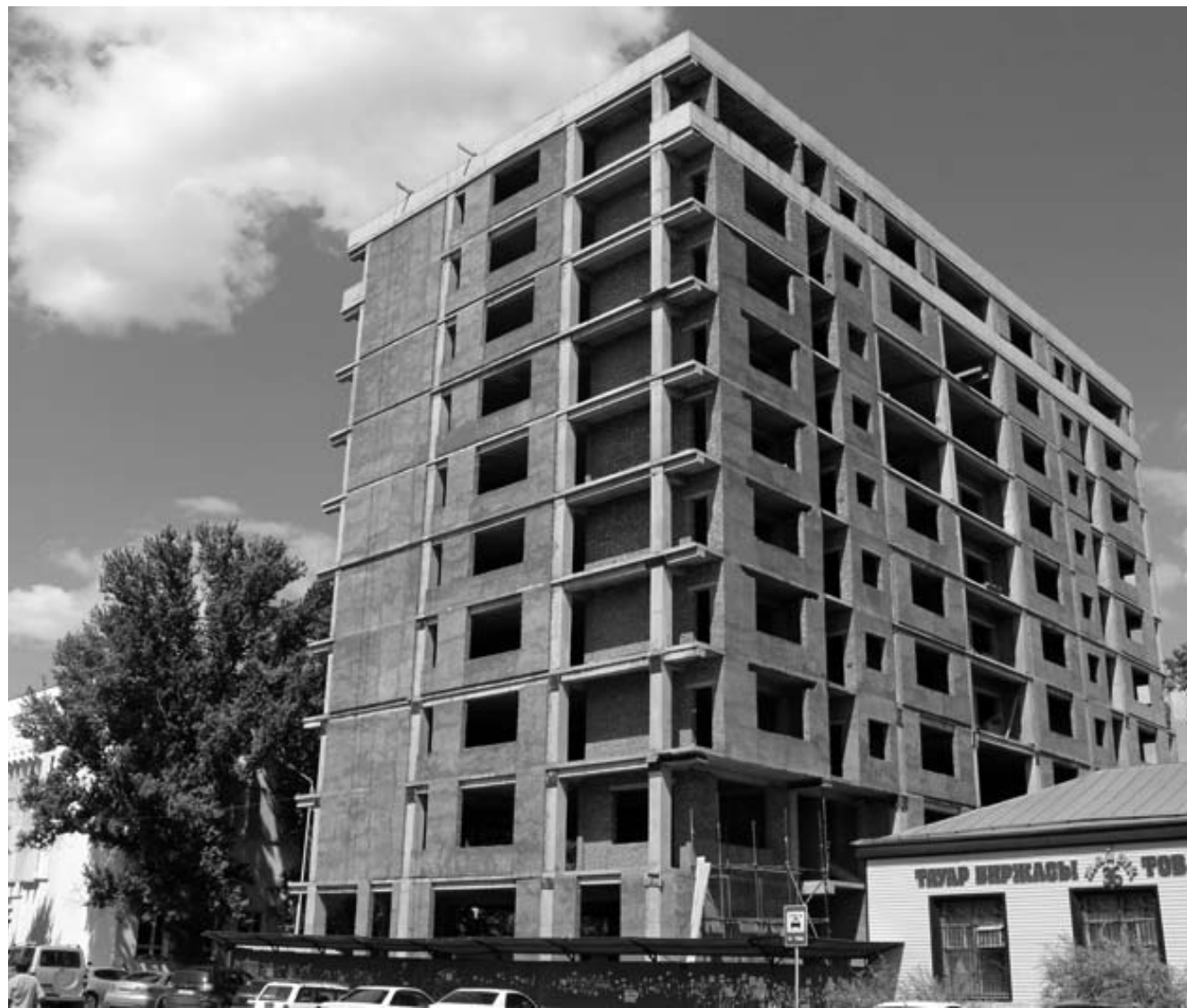
Гали Искалиев отметил, что недостроенные здания представляют серьезную опасность безопасности населения.

– На сегодняшний день из 24 объектов по 11 возобновлены строительные работы. Так, здание №177 по проспекту Назарбаева (бывшее здание типографии – прим. автора) сейчас находится в залоге банка, проводятся переговоры по выдаче кредита для проведения капитального ремонта. Собственником ТОО «Идеал Маркет» произведена уборка помещений и прилегающей территории от бытового и строительного мусора. Выполнены работы по ремонту фасада здания и восстановлению остекления окон. Собственником административно-бытового здания по адресу: ул. Чапаева, 18 является ГКП на ПХВ «Западно-Казахстанский государственный университет им. М. Утемисова». Проведено техническое обследование здания. Разработана проектно-сметная документация на реставрационные работы и получено положительное заключение