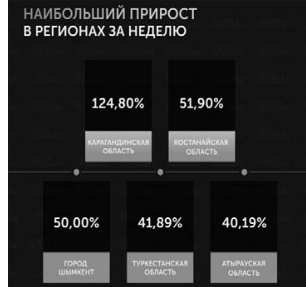
Темп прироста заболевших 24 мая составил 5,1 процента за сутки по всей стране. Это наибольший показатель за неделю.

сотрудников организаций жизнеобеспечения населения, а также лиц, выезжающих и въезжающих по медицинским показаниям, а также выезжающих из карантинных зон, с указанием диагноза и подтверждением срочности, подписанное первым руководителем и заверенное гербовой печатью.