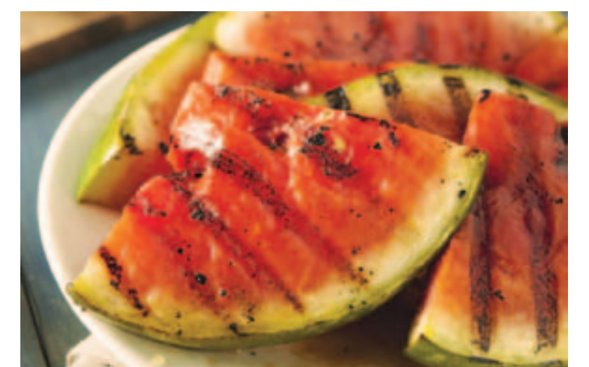
Арбуз, жаренный на гриле. Не спешите воротить носом, это не кулинарное извращение, а очень даже вкусно! Не забудьте сбрызнуть оливковым маслом и присыпать молотым черным перцем. Готовьте по 10 секунд с каждой стороны.