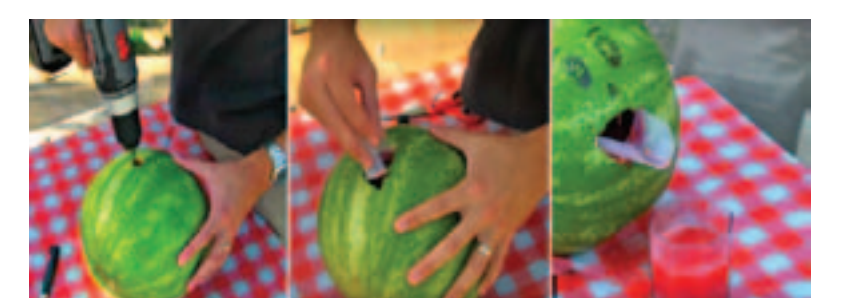
А вот как быстро напоить большую компанию арбузным фрешем. Просверлив отверстие в кожуре, находчивый мужчина надел на дрель насадку, похожую на венчик, и взбил всю мякоть. Осталось присоединить воронку из пластикового стаканчика – можно наслаждаться напитком.

Как бы вы ни решили подать эту суперягоду, помните, что арбуз арбузу рознь. Не всегда можно отрезать ломтик и попробовать мякоть на вкус. Принохайтесь: если учуете фруктово-медовые нотки, смело покупайте арбуз. А вот кислотатый душок говорит о том, что продукт начал внутри подгнивать. Фантазируйте, пробуйте, экспериментируйте – у вас обязательно получится.