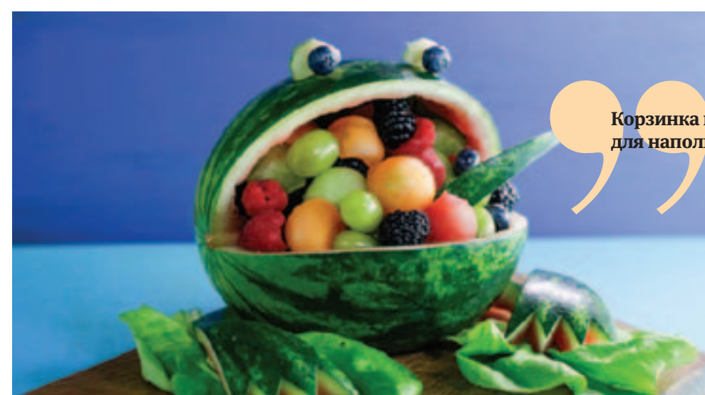
Корзинка из арбуза в виде забавной лягушки. Помимо, собственно, арбузной мякоти для наполнения отлично подойдут любые кисло-сладкие сезонные фрукты.

Арбуз, арбузик, арбузище! Яркая, полезная ягода, к тому же до жути вкусная. При одном взгляде на сочную мякоть хочется сразу вгрызться в нее зубами и, причмокивая, только успевать выплевывать семечки в чашку... Конечно, в одиночку не возбраняется, а вот для праздника нужно придумать более интересные методы поедания этой вкуснятины.