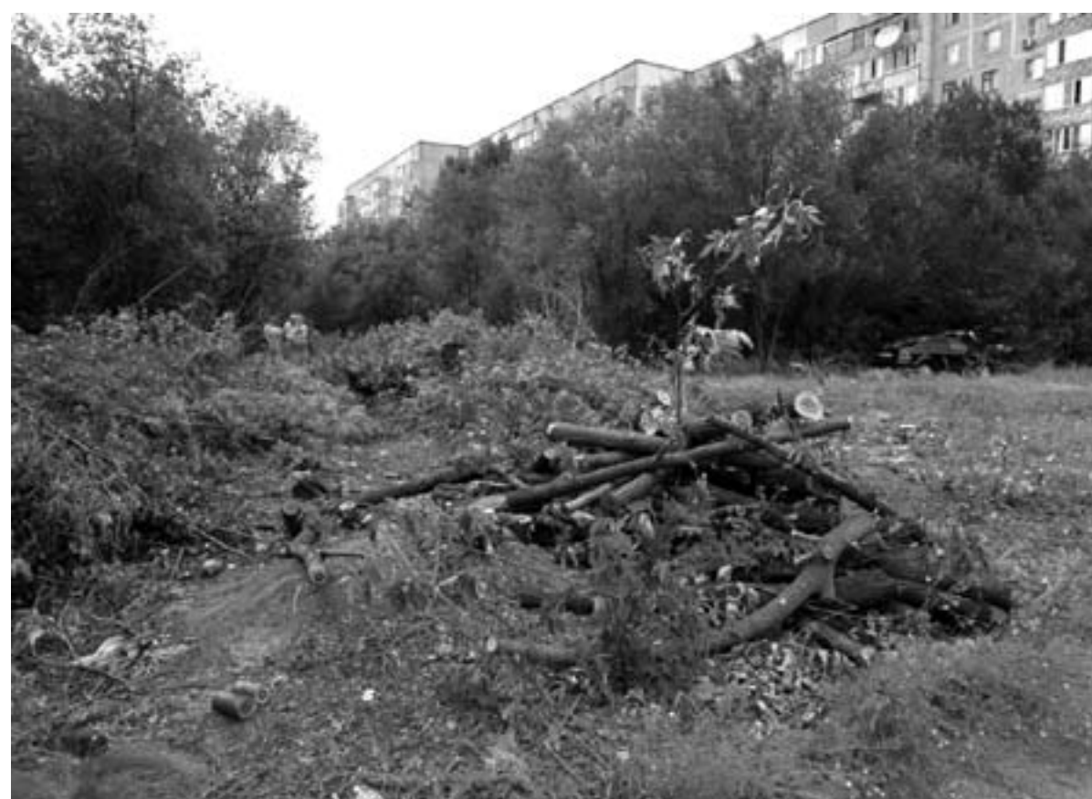
Последний скандал вокруг массового уничтожения деревьев разразился в 6 микрорайоне. 19 июля в микрорайоне Кунаева рядом с домами №10, 11 и 18 началось строительство ресторана.

Первый раз "скальп" с деревьев в этом месте сняли в февра-