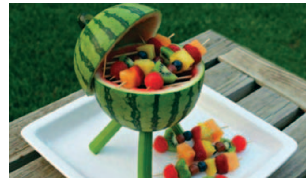
Фруктовые шашлычки на деревянных шпажках. Можно подать на обычной тарелке, но на «мангале» из арбузной кожуры интереснее же!