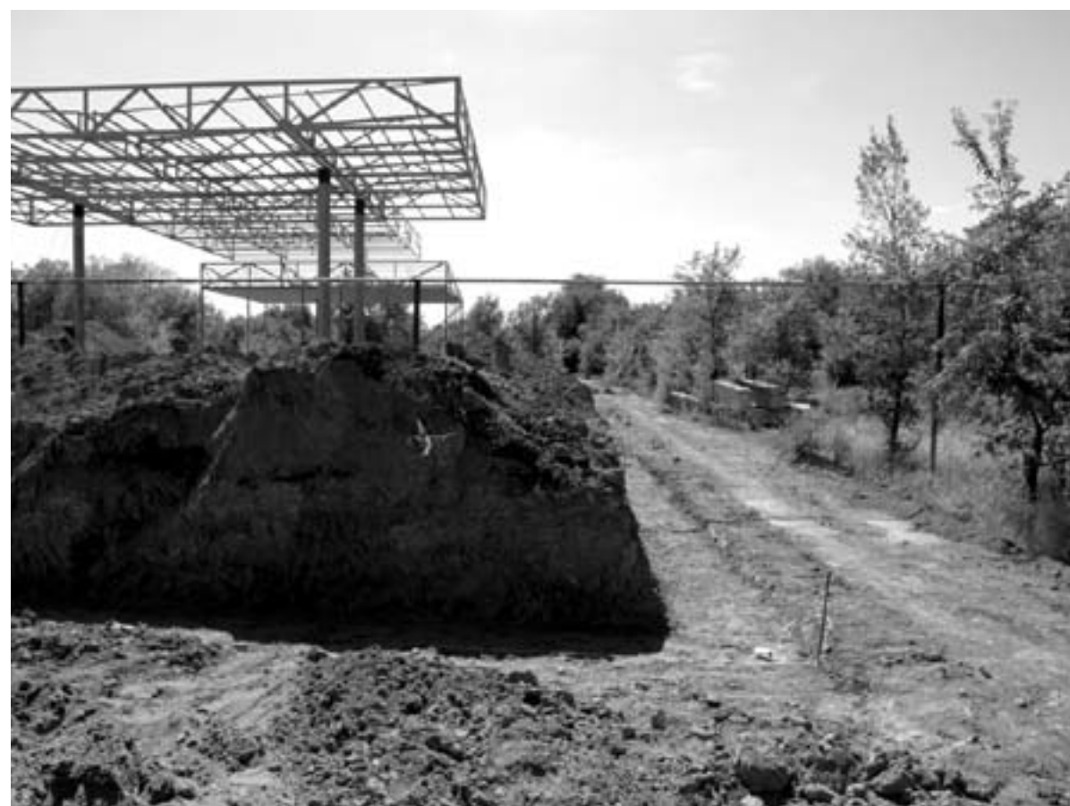
А здесь ведется строительство очередной АЗС по улице Жангир хана в районе СОШ №20.

ле 2014 года. Тогда в ЖКХ заявили, что они просто подстригли деревья во благо безопасности горожан и что дальше деревья будут расти. А в апреле 2014 года деревья окончательно вырубали, и на месте ранее цветущих карагачей посадили березы и ели, которые, к сожалению, так и не прижились. По сло-