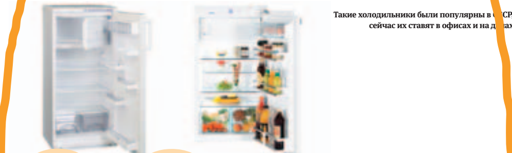
Такие холодильники были популярны в СССР, сейчас их ставят в офисах и на дачах

Мощность морозилки обозначается снежинками. Одна снежинка – температура около –6 °С, продукты можно хранить неделю. Две снежинки – температура –12 °С, еда спокойно пролежит месяц. Три и более снежинок говорят о том, что в морозилке –18 °С и продукты могут лежать там до года.