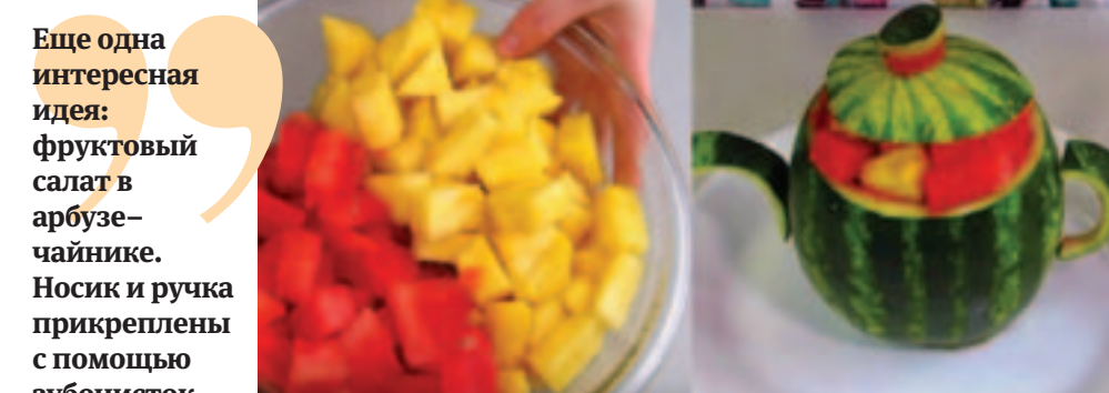
Еще одна интересная идея: фруктовый салат в арбузе-чайнике. Носик и ручка прикреплены с помощью зубочисток.