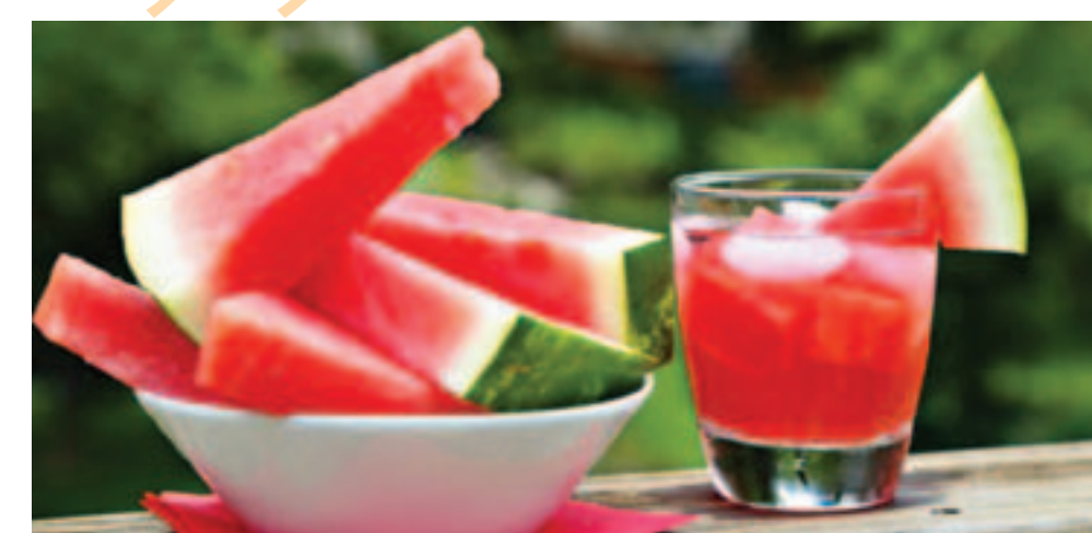
Нарезанный крупными ломтиками и подмороженный арбуз – отличное освежающее лакомство. С таким фруктовым льдом прохладительные напитки будут еще и полезными.