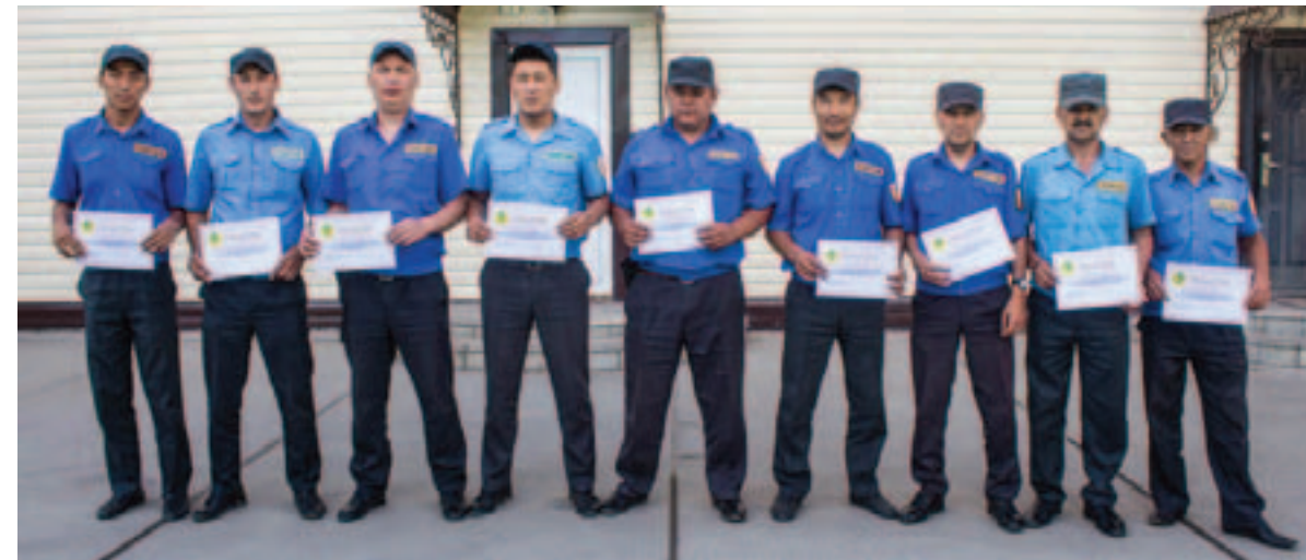
Лицензия №14008541 от 12.06.2014г. выдана отделом гос. охраны ДВД ЭКО МВД РК.