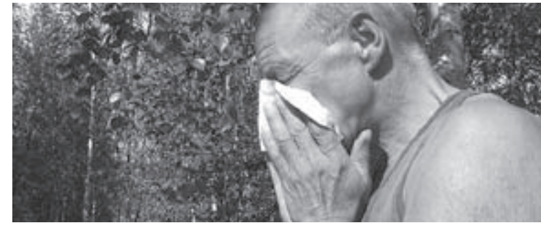
до приезда «скорой помощи».

Укусы насекомых. Они нередко вызывают зуд, покраснение, отёк. Если вас ужалили в лицо или шею, лучше обратиться к врачу, ведь в этом случае может возникнуть системная аллергическая реакция (отёк Квинке или анафилактический шок). Это особенно опасно для людей, которые ранее уже сталкивались с такой реакцией, – они должны всегда иметь под рукой инъекции гормональных и антигистаминных препаратов, которые нужно экстренно принять