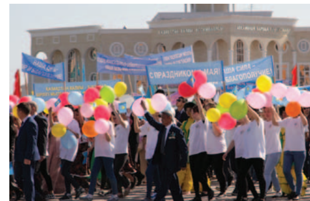
Всего было 10 колонн, которые включили в себя более 100 предприятий.