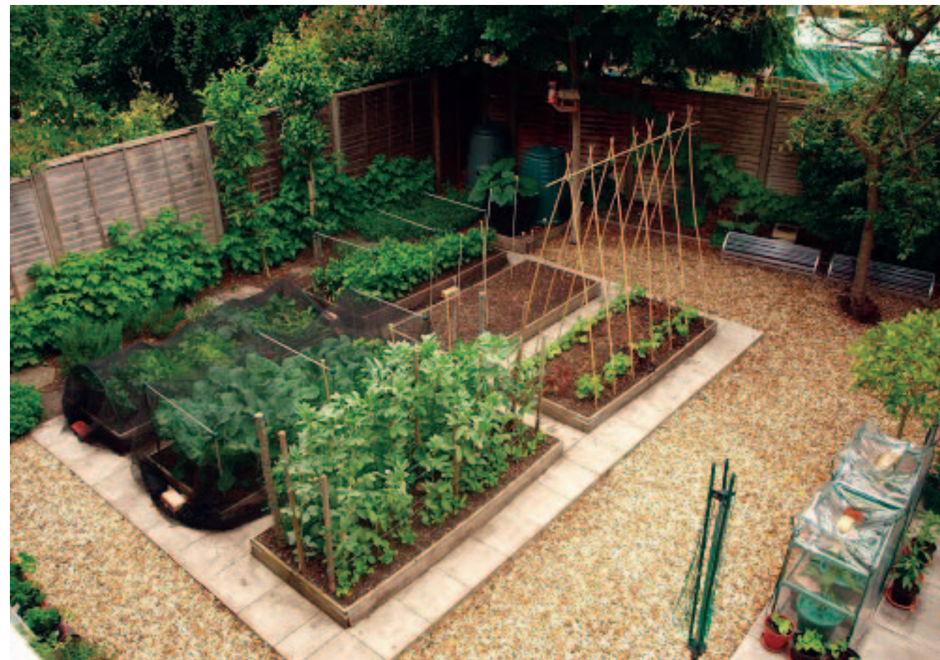
Например, на месте лука и чеснока

Что касается плодовых деревьев и кустарников, то их нужно стараться высаживать так, чтобы они отбрасывали тень (поскольку солнце с юга) строго на север. Лучше, чтобы она ложилась на забор или хозяйской постройки, но не на посадки.