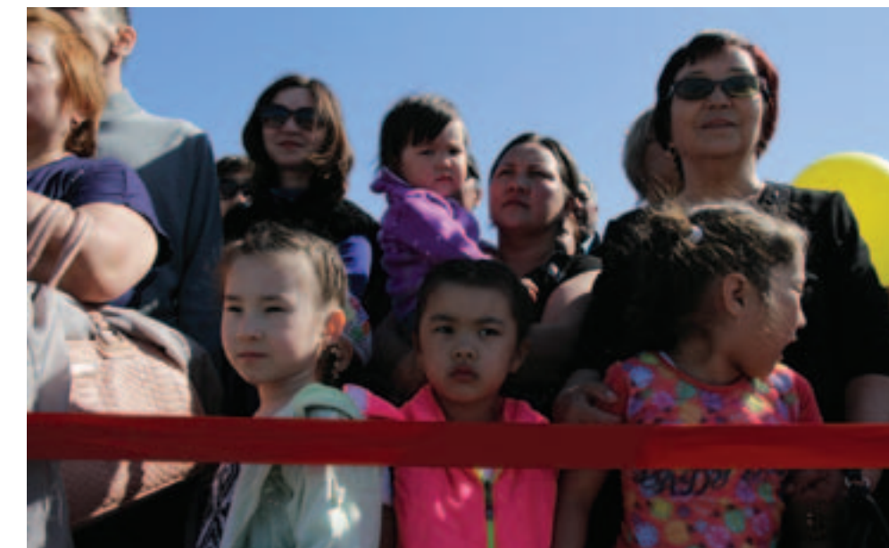
Шествие, как и предполагалось, закончилось через 40 минут после начала. Однако не все участники остались довольны организацией праздника.