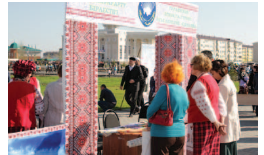
Около центра Кадыра Мырза Али этнокультурные объединения области организовали мини-городки, где каждый желающий мог отве- дать традиционную национальную кухню и поучаствовать в спортивных состязаниях.