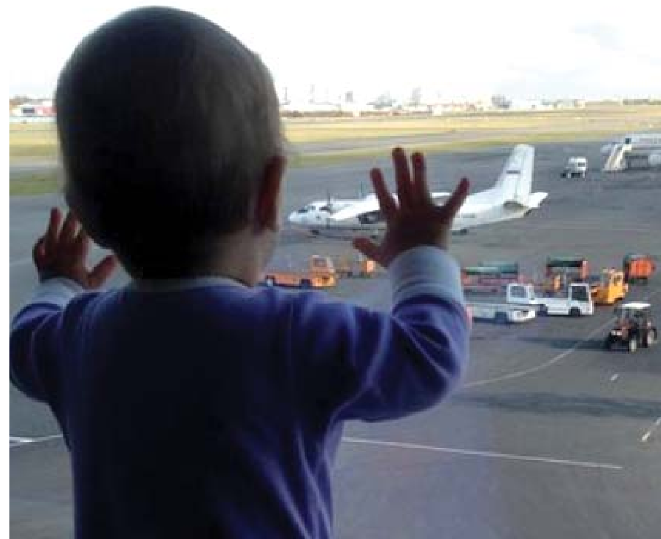
На борту самолета Airbus-321, потерпевшего крушение в Египте, находилась молодая семья с маленькой дочкой. В социальных сетях еще перед вылетом в Египет мать девочки поделилась со своими подписчиками сразу несколькими снимками. Под одной из фотографий девушка написала: "Ура! Летим греться". Позднее выложила фото малышки, подписав его: "Главный пассажир".

"По предварительным данным, гражданин Казахстана на борту потерпевшего крушения авиалайнера, совершавшего рейс