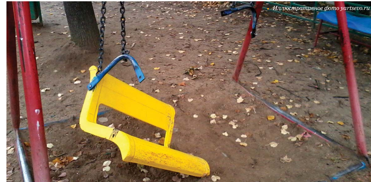
Иллюстративное фото yartsevo.ru

Было озвучено и то, что имеет место несвоевременное направление детей на психолого-медико-педагогическое обследование на врачебные комиссии для установления степени инва-