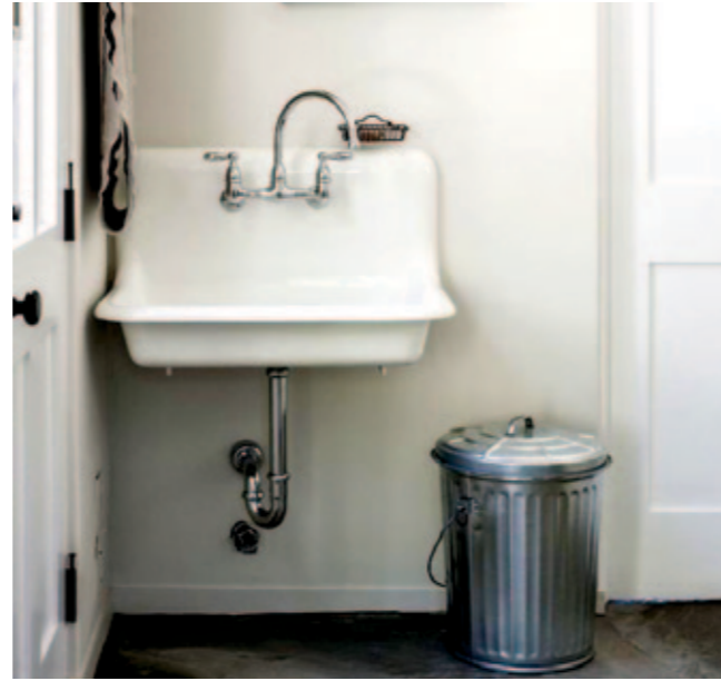
Источником шума могут служить сантехнические приборы.

Определите источник шума. Если полностью устранить шум от данного источника невозможно, постарайтесь его минимизировать.