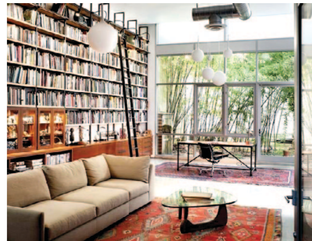
Книги эффективно поглощают шум.

Проще и эффективнее всего избавиться от паразитных шумов от телевизора, сняв его со стены и установив на тумбу. Если такой вариант вам не подходит, используйте менее жесткое крепление на стену.