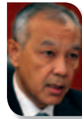
Прокурор ЗКО Сапарбайк НУРПЕЙСОВ

Страшные данные были озвучены на заседании коллегии прокуратуры ЗКО по защите прав интересов детей-сирот и оставшихся без попечения родителей.