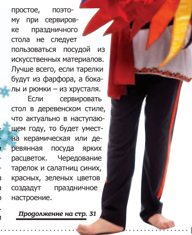
Продолжение на стр. 31