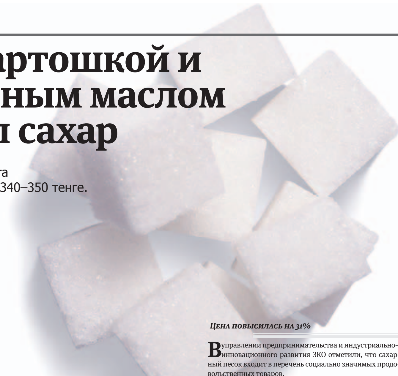
Цена повысилась на 31%

Действительно, цена на сахар повысилась. Если раньше 1 килограмм продукта можно было купить за 290–310 тенге, то сейчас на одном из крупных рынков города