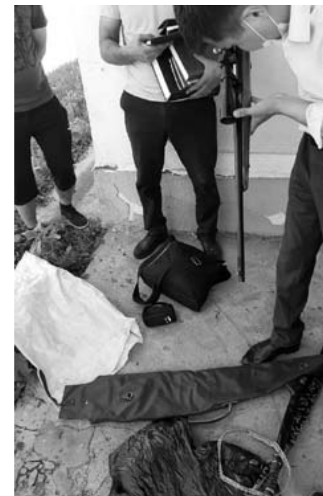
«Калашникова» в количестве трех штук, спичечный коробок и пачка из под сигарет с дробью, нарезное ружье марки «ЮСЬ-7», кинжал (сабля), деревян-

перевозка или ношение оружия, боеприпасов, взрывчатых веществ и взрывных устройств». Как выяснилось, владелец КХ ранее отбывал наказание в местах лишения свободы в Российской Федерации, но был освобожден досрочно, после чего в 2016 году в Казахстане был осужден за кражу, – рассказали в пресс-службе ведомства. В ходе обыска по месту жительства предпринимателя было обнаружено и изъято незарегистрированное ружье марки MAVERIC (винчестер), 11 патронов 12 калибра, 3 ножа (кинжала), один патрон калибра от автомата «Калашникова», набор для чистки ружей, наручники в чехле с ключом. Там же были обнаружены религиозные книги и тетрадь. В ходе обыска крестьянского хозяйства была обнаружена одна боевая граната, а также боевые патроны от пистолета «Макарова» в количестве 16 штук, боевые патроны снаряженные в магазин от автомата