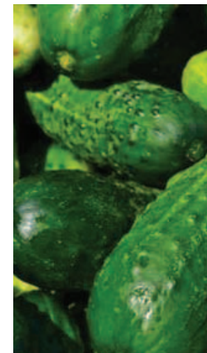
Вкусовые рецепторы сорта: сладкие, ароматные, свежие плоды, не обладающие горечью.

Мякоть огурцов Тополек плотная, хрустящая, сочная, не имеющая пустых пространств;