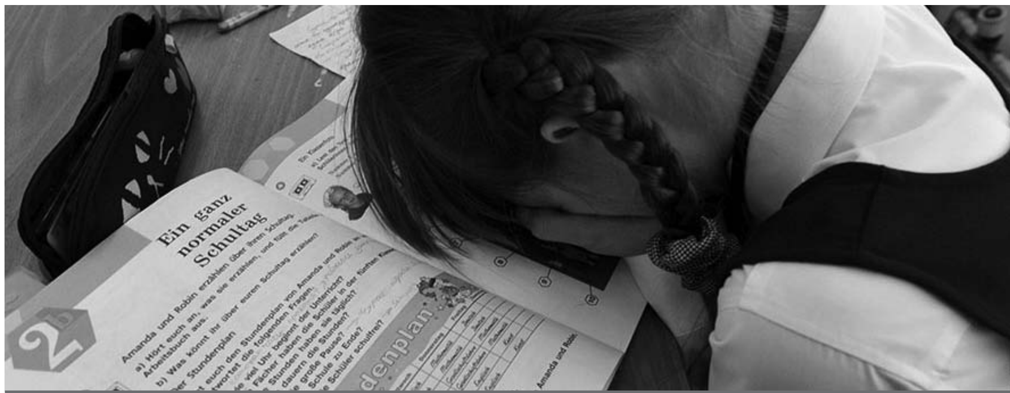
Иллюстрационное фото © сайта psy-files.ru