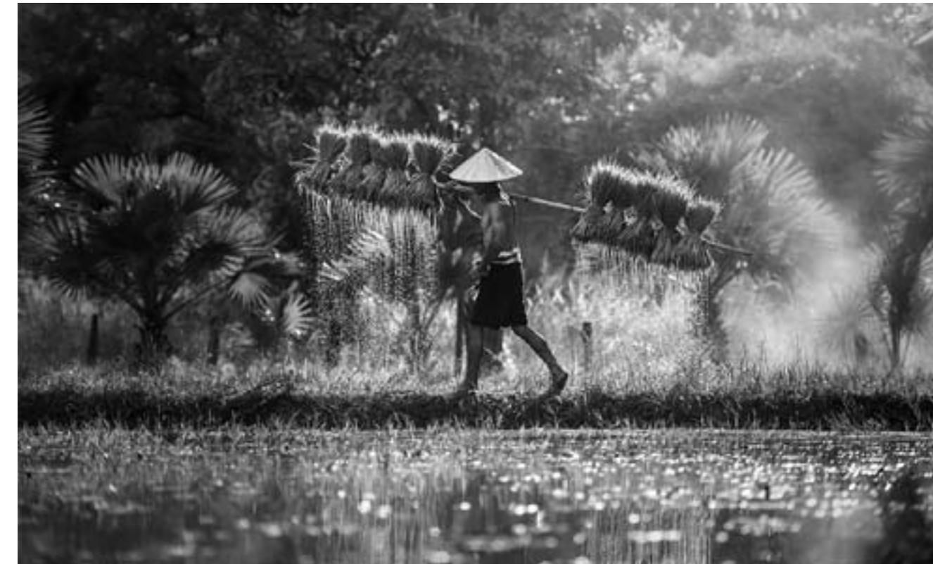
Рис вовсе не влаголюбивая культура, но почему тогда его выращивают в воде

не нужно много ингредиентов. В этом весь смысл блюда. Только базовые компоненты и удивительный вкус. Искренне надеюсь, что и этот способ пополнит твою записную книгу рецептов.