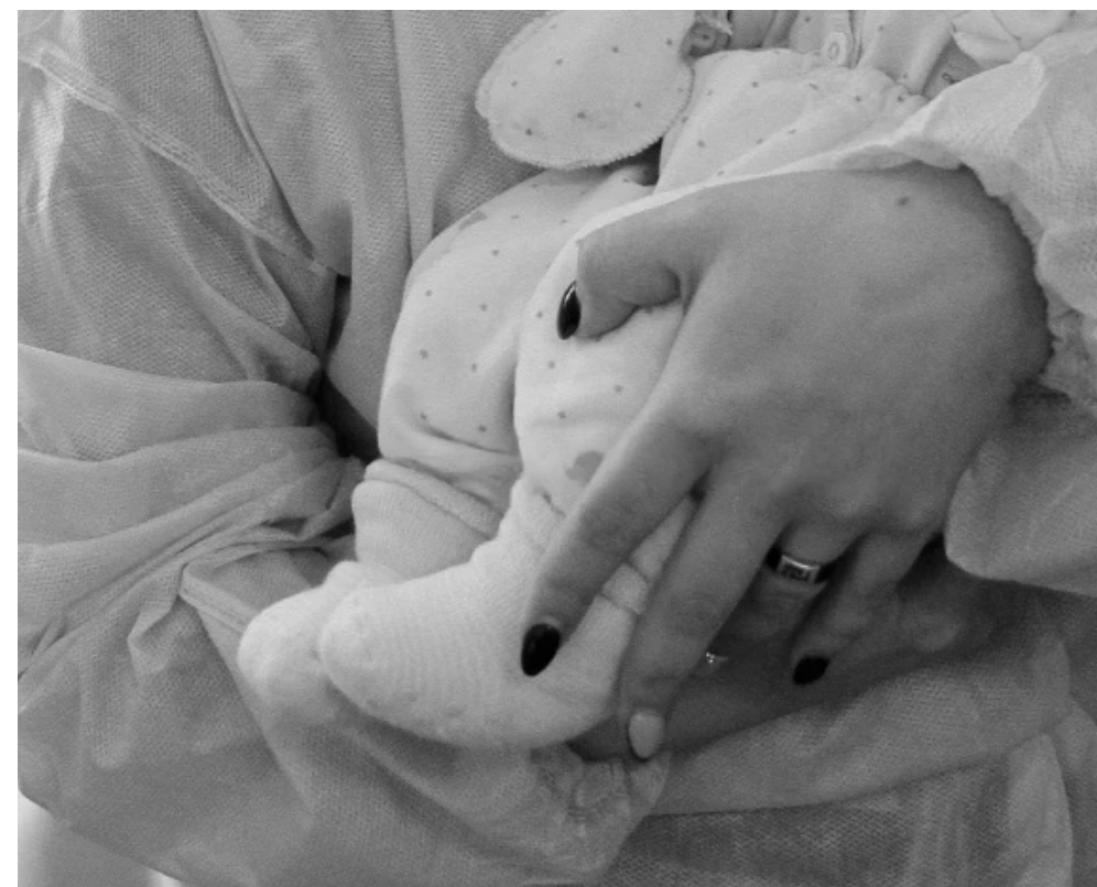
Иллюстративное фото из архива «МГ»

Он отметил, что основная причина – отказы от профилактического лечения как взрослых, так и родителей детей, является непродуманным решением, последствием