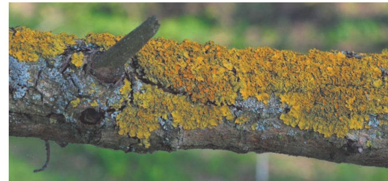
Источник: Аиф дача

Например, бульбокодидум весенний, или брундушка ( Bulbocodium v e m = C o l c h i u m bulbocodium ), с крупными розово-сиреневыми цветками и золотисто-жёлтый эрантус, или весенник ( Eranthis ). К «торопыжкам» относится крокус Томазини ( Stocus tommasianus ) и его сорта. И конечно, гусиный лук, или gaga ( Gagea ), с простенькими, но милыми жёлтыми звёздочками цветков - находка для любителей природного стиля и лентяев: посадил в конце августа и забыл.