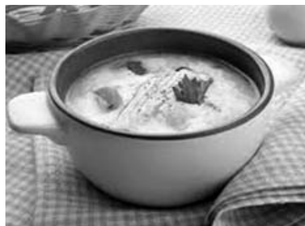
ного подкопченного сыра, натертого на терке, и плавно перемешиваем. Если у ваших домашних гурманов нет предробужденной насчет сыра с плесенью, смело добавляйте и его. Когда сыр расплавится, снимаем суп с огня. Аппетитный сырный супчик готов!

Шаг 4. Выкладываем в кастрюлю 300 г колбас-