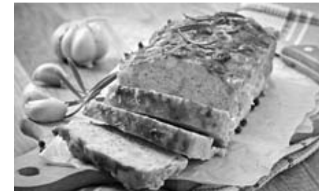
ляем щепотку сушеного базилика.

Шаг 2. Обжариваем в масле луковичку и 100 г шампиньонов до золотистого цвета, добав-