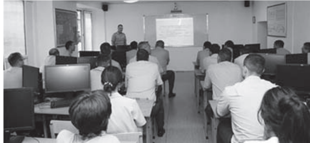
учебного процесса и учебно-материальной базой.

На сборах обсуждались актуальные проблемы перехода военных вузов на образовательные стандарты нового поколения, внедрения нового перечня номенклатуры специальностей, перестройка сложившейся системы контроля качества высшего образования, активный переход к использованию в учебном процессе информационных технологий. Большое внимание уделялось вопросам укрепления научно-педагогического потенциала военных вузов, повышения квалификации профессорско-преподавательского состава. В ходе мероприятия участники ознакомились с организацией