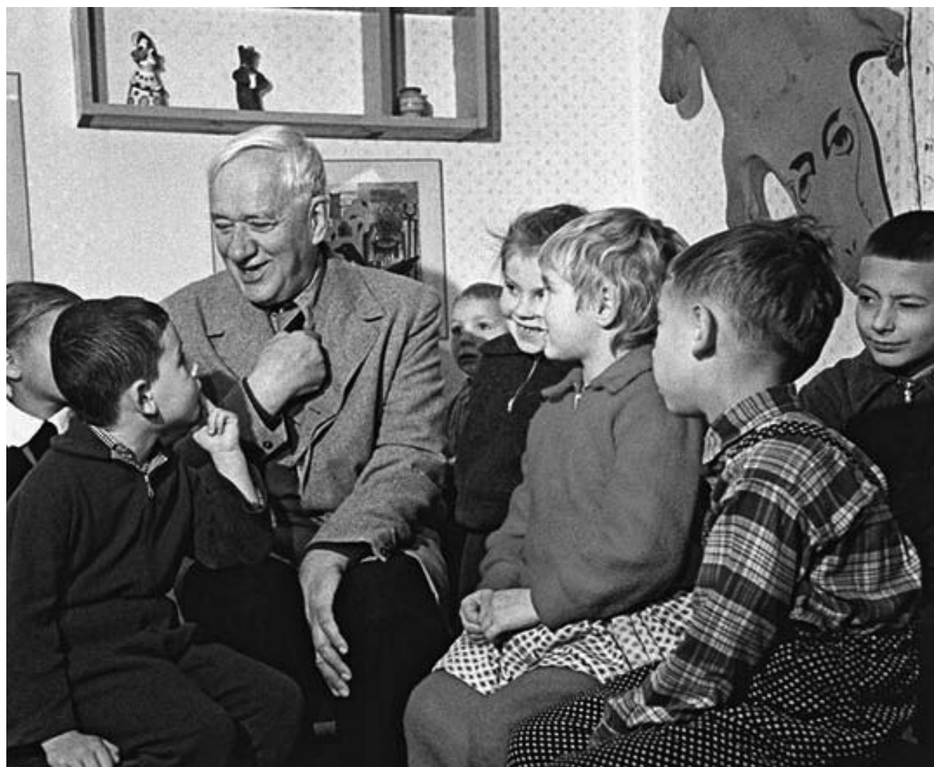
Корней Чуковский во время встречи со своими юными читателями в детской библиотеке в Перedelкинe.