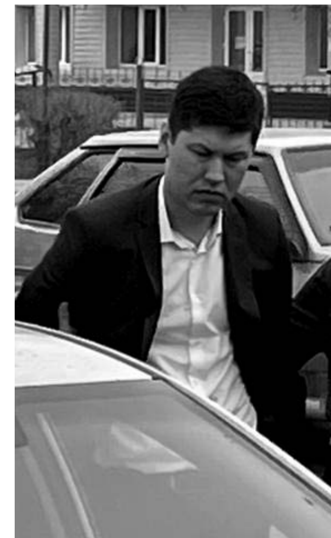
Арайлым УСЕРБАЕВА

Прокурор запросил для подсудимого 15 лет лишения свободы и выплату моральной компенсации в